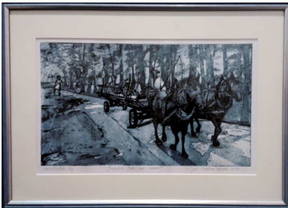
Grafika »Franckin tek za vozom«, avtorica Joži Nastran Brank

Avtorji so prejeli priznanja JSKD, z mislimi pa so že pri natečaju za leto 2019.