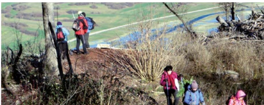
Sv. Primož nad Pivko: pogled na Pivško polje s terena pri vojaških utrdah

Zadnji novembrski pohod smo izvedli na nekoliko nižji, pa vendar lep razgledni hrib nad Pivko, Šilen tabor (751 m). Pohod v lepem vremenu je občasno motila dokaj močna burja, še zlasti na izpostavljenih mestih in grebenskem vrhu. Še sreča, da v tistih krajih poznajo burjo in so na vrhu, ali bolje tik pod vrhom, naredili počivališče s klopco v prijetnem zavetrju. Razgled je bil lep na okoliške hribe. Nekaj od bolj znanih smo tudi že obiskali: Sv. Trojica, Kršičevce, Vremščica, Slavnik, Snežnik ... Ob vrnitvi proti Pivki smo zavili še na Sv. Primoža (718 m) nad Pivko, kjer smo si ogledali ostanke utrd in se seznanili z manj znano zgodovino in zgodbami, ki so lepo predstavljene na informativnih tablah ob poteh. Ko gar zanima zgodovina, mu lepo pri-