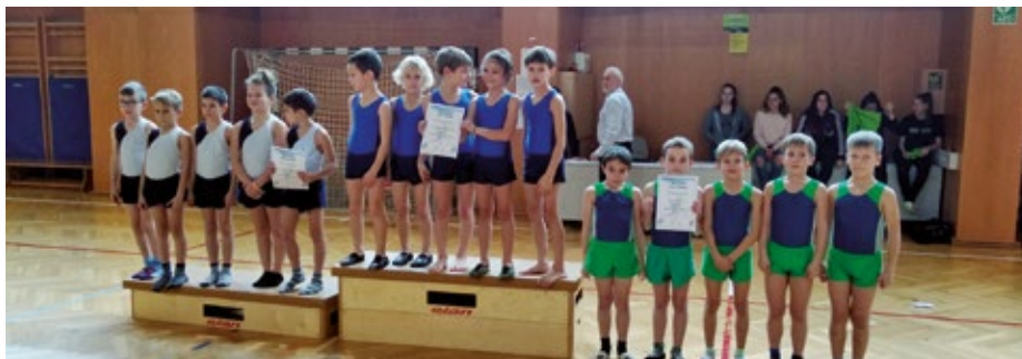
Najmlajši dečki – ekipno 3. mesto